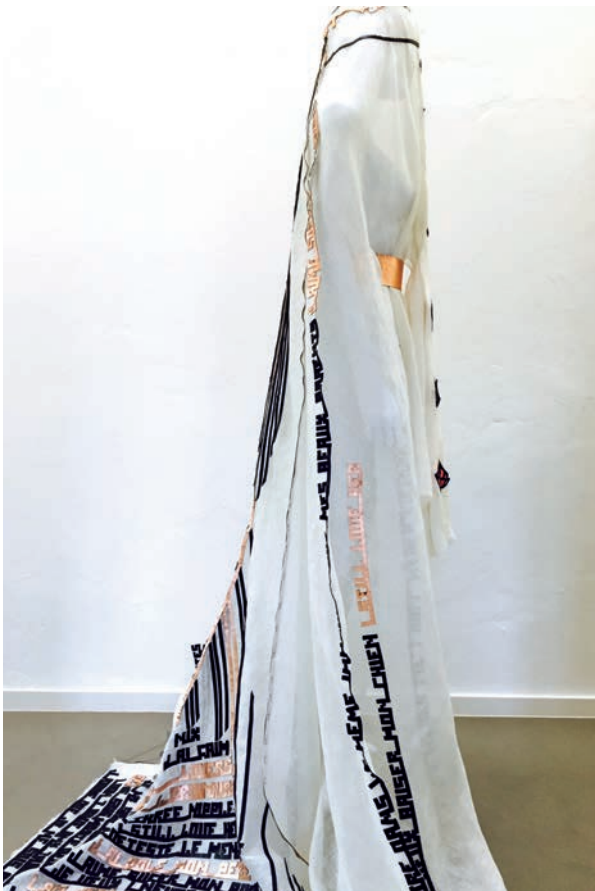
Verschleierung, 2015, aus der Serie „Die gefangenen Münder“, Künstlerische Performance, Leder, Baumwollfäden

Les portraits exposés font partie d'une série de 8 tableaux. Le motif du «moucharabieh» se superpose telle une fenêtre sur les visages de femmes et nous renvoie au fait que nous avons toutes nos moucharabiehs que nous portons tel des masques face aux différentes situations de la vie. Certaines en jouent, d'autres le subissent. Ils représentent pour certaines un abri, un refuge, une barrière; pour d'autres, une prison. Text und Übersetzung: Luc Braconnier; Fotos: Sophie Medawar