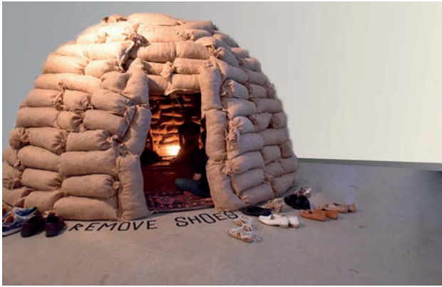
Installation, 2015, Sandsäcke, iranischer Teppich, Ton und Licht, 330 cm Durchmesser, 220 cm Höhe