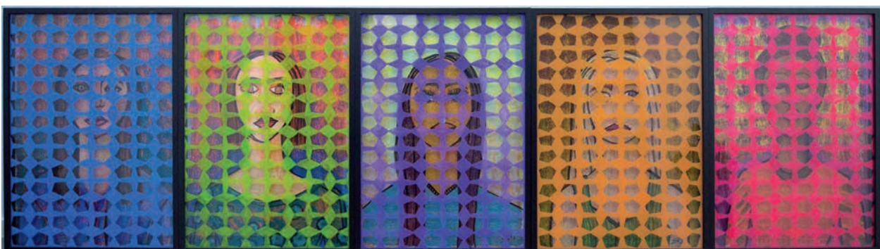
Cache - Cache, 2014, Serie Kopf an Kopf Pastellfarben/Holz/Glas/Acryl, 50 x 70 cm jedes Porträt